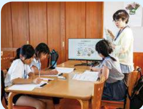
長坂町の「緑の風」で、利用者たちが集まる様子。

「自分がいい暮らしを営むことに向けて、ほんの少しだけの手助けをすることが、私たちの提供するサービスであり、私